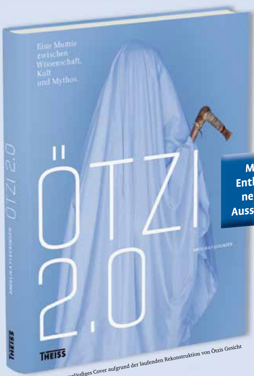
vorläufiges Cover aufgrund der laufenden Rekonstruktion von Ötzis Gesicht